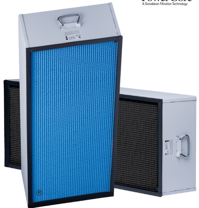
PowerCore® TG Filter Pack (available in flame-retardant and anti-static)